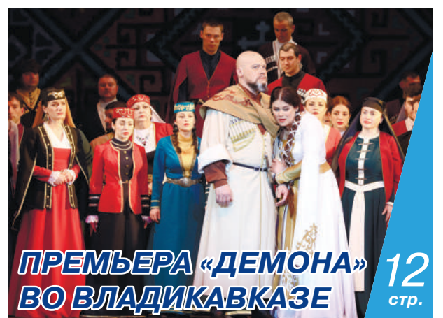
ПРЕМЬЕРА «ДЕМОНА» ВО ВЛАДИКАВКАЗЕ