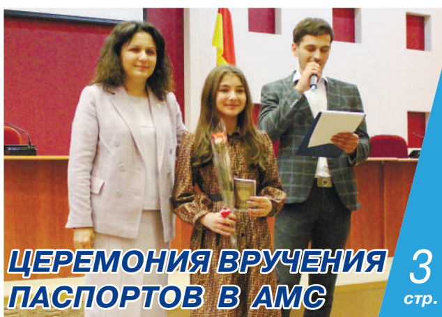
ЦЕРЕМОНИЯ ВРУЧЕНИЯ ПАСПОРТОВ В АМС