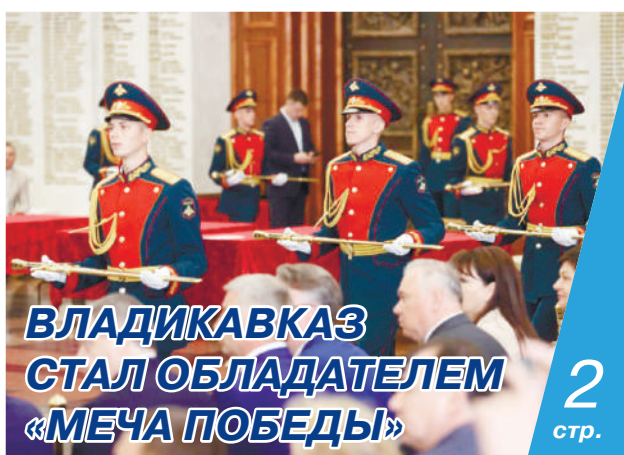
ВЛАДИКАВКАЗ СТАЛ ОБЛАДАТЕЛЕМ «МЕЧА ПОБЕДЫ»