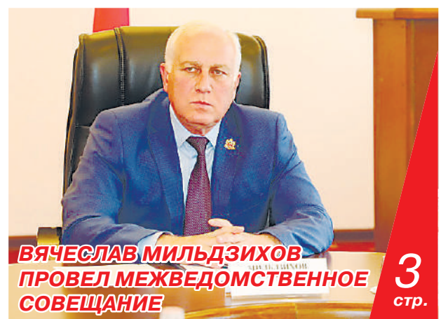
ВЯЧЕСЛАВ МИЛЬДЗИХОВ ПРОВЕЛ МЕЖВЕДОМСТВЕННОЕ СОВЕЩАНИЕ