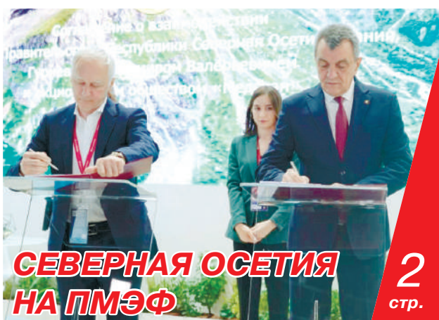
СЕВЕРНАЯ ОСЕТИЯ НА ПМЭФ