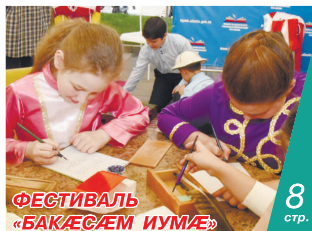
ФЕСТИВАЛЬ «БАКАСАЕМ ИУМАЕ»