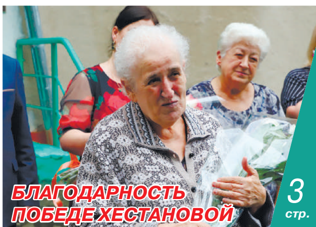
БЛАГОДАРНОСТЬ ПОБЕДЕ ХЕСТАНОВОЙ