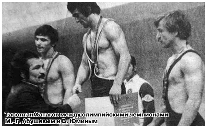
Тасолтан Хатагов между олимпийскими чемпионами М.-Г. Абушевым и В. Юминым

О хорошем борце часто говорят: «У него есть «душок». Так оценивается