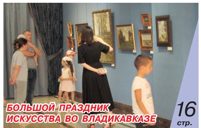
БОЛЬШОЙ ПРАЗДНИК ИСКУССТВА ВО ВЛАДИКАВКАЗЕ