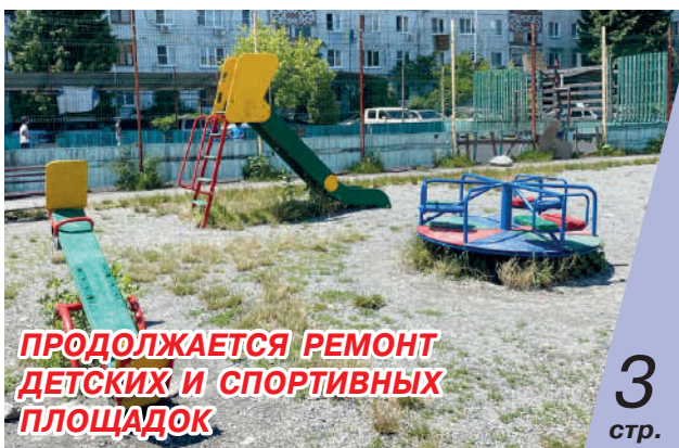
ПРОДОЛЖАЕТСЯ РЕМОНТ ДЕТСКИХ И СПОРТИВНЫХ ПЛОЩАДОК

региональных и федеральных органов исполнительной власти РСО-А с авторитетными спикерами на тему внешней и внутренней политики Российской Федерации через призму Северного Кавказа.