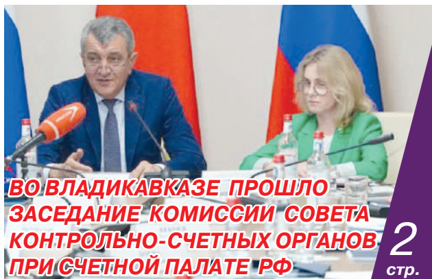
ВО ВЛАДИКАВКАЗЕ ПРОШЛО ЗАСЕДАНИЕ КОМИССИИ СОВЕТА КОНТРОЛЬНО-СЧЕТНЫХ ОРГАНОВ ПРИ СЧЕТНОЙ ПАЛАТЕ РФ