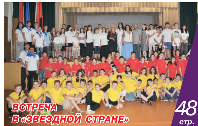
ВСТРЕЧА В «ЗВЕЗДНОЙ СТРАНЕ»