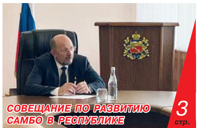
СОВЕЩАНИЕ ПО РАЗВИТИЮ САМБО В РЕСПУБЛИКЕ

Инициатива проведения медиафорума «PRO Кавказ» принадлежит Главе Северной Осетии Сергею Меняйло.