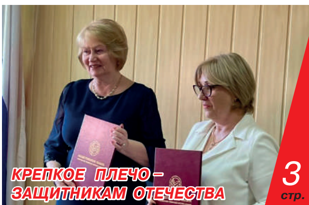
КРЕПКОЕ ПЛЕЧО – ЗАЩИТНИКАМ ОТЕЧЕСТВА