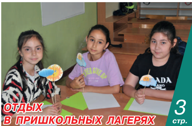
ОТДЫХ В ПРИШКОЛЬНЫХ ЛАГЕРЯХ