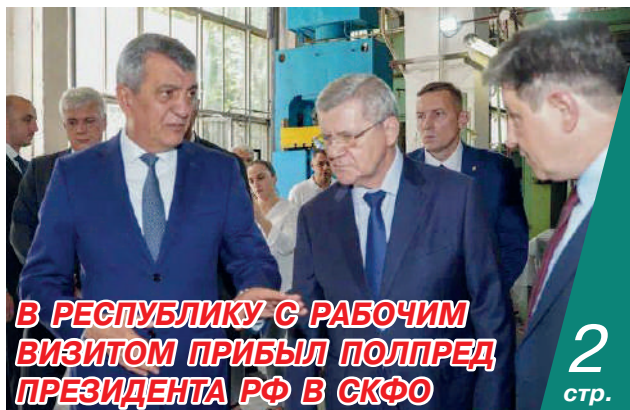
В РЕСПУБЛИКУ С РАБОЧИМ ВИЗИТОМ ПРИБЫЛ ПОЛПРЕД ПРЕЗИДЕНТА РФ В СКФО

В СЕВЕРНОЙ ОСЕТИИ СТАНЕТ НА 250 МЕСТ РАЗМЕЩЕНИЯ ТУРИСТОВ БОЛЬШЕ