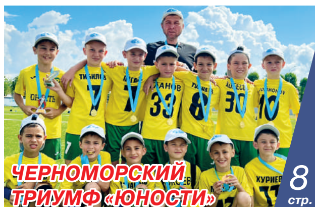
ЧЕРНОМОРСКИЙ ТРИУМФ «ЮНОСТИ»