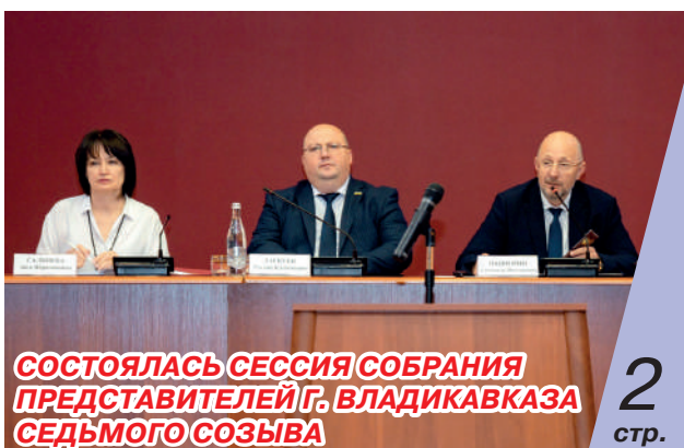
СОСТОЯЛАСЬ СЕССИЯ СОБРАНИЯ ПРЕДСТАВИТЕЛЕЙ Г. ВЛАДИКАВКАЗА СЕДЬМОГО СОЗЫВА

это набережная реки Терек, где в скором времени появится новая смотровая площадка. Работа уже идет полным ходом.