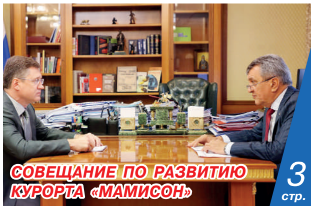
СОВЕЩАНИЕ ПО РАЗВИТИЮ КУОРТА «МАМИСОН»