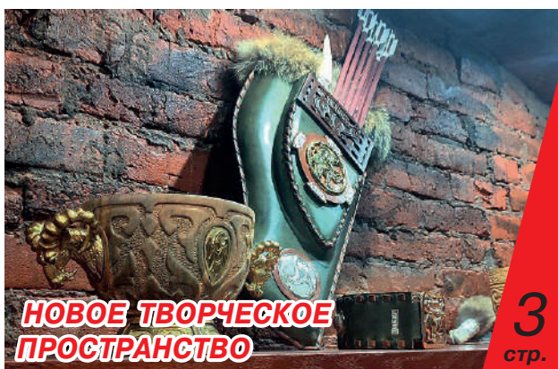
НОВОЕ ТВОРЧЕСКОЕ ПРОСТРАНСТВО