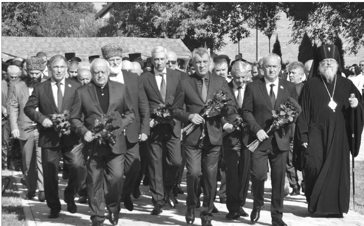
(Кæрон. Райдиан 1-æм фарсыл)