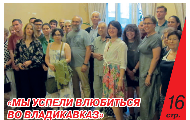
«МЫ УСПЕЛИ ВЛЮБИТЬСЯ ВО ВЛАДИКАВКАЗ»