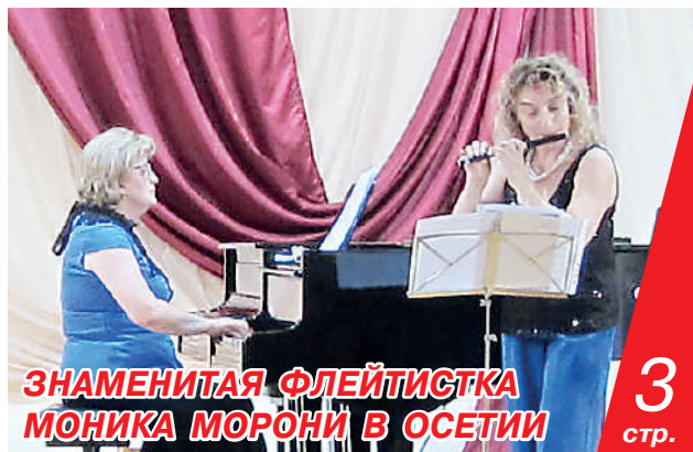
ЗНАМЕНИТАЯ ФЛЕЙТИСТКА МОНИКА МОРОНИ В ОСЕТИИ