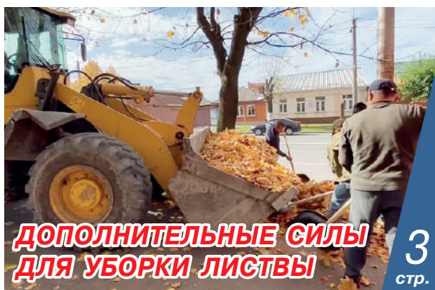
ДОПОЛНИТЕЛЬНЫЕ СИЛЫ ДЛЯ УБОРКИ ЛИСТВЫ 3 стр.