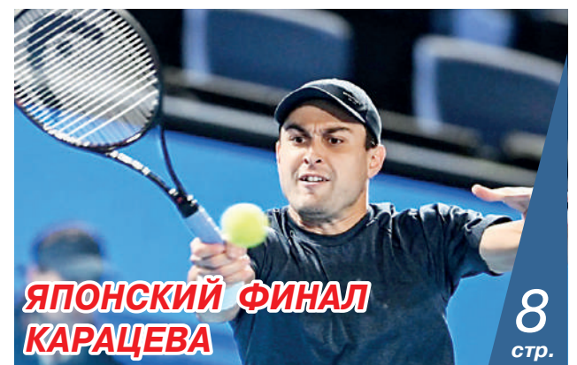
ЯПОНСКИЙ ФИНАЛ КАРАЦЕВА 8 стр.