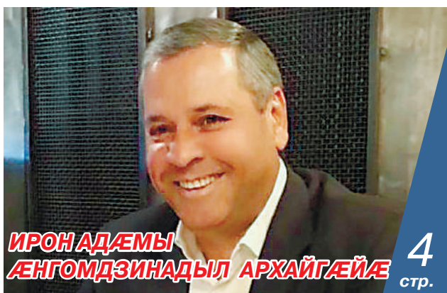
ИРОНАДЕМЫ ЛЕНГОМДЗИНАДЫЛ АРХАЙГАЙÆ 4 стр.