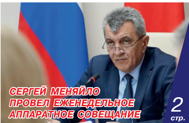
СЕРГЕЙ МЕНЯЙЛО ПРОВЕЛ ЕЖЕНЕДЕЛЬНОЕ АППАРАТНОЕ СОВЕЩАНИЕ

Уыцы тугуарæн бонты Ирыстоны æхсарджын фырттæй бирæтæ сæ удтæ нывондæн æрхастой нæ Иры сæрвæлтау æмæ сæ риутæй бахъахъхъæдтой нæ фыдæлты зæхх.