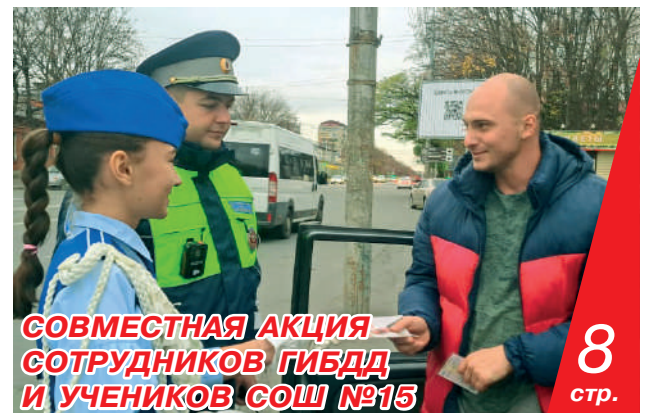
СОВМЕСТНАЯ АКЦИЯ СОТРУДНИКОВ ГИБДД И УЧЕНИКОВ СОШ №15 8 стр.