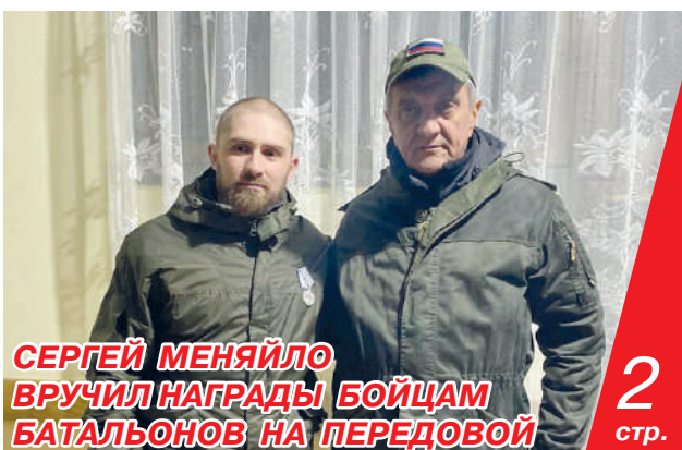
СЕРГЕЙ МЕНЯЙЛО ВРУЧИЛ НАГРАДЫ БОЙЦАМ БАТАЛЬОНОВ НА ПЕРЕДОВОЙ