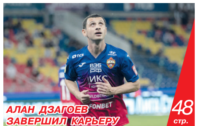
АЛАН ДЗАГОЕВ ЗАВЕРШИЛ КАРЬЕРУ