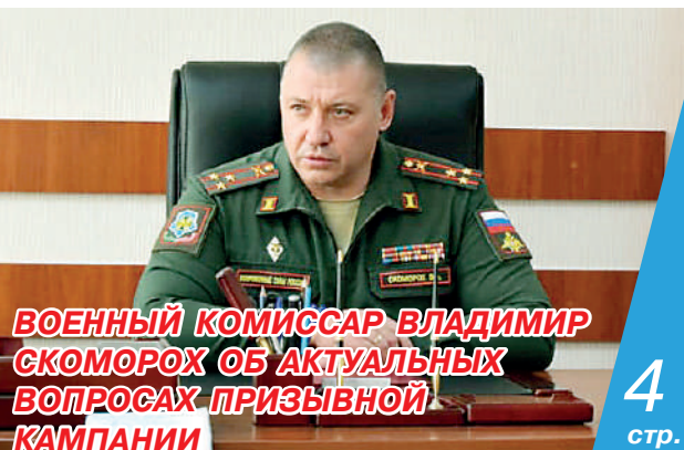
ВОЕННЫЙ КОМИССАР ВЛАДИМИР СКОМОРОХ ОБ АКТУАЛЬНЫХ ВОПРОСАХ ПРИЗЫВНОЙ КАМПАНИИ