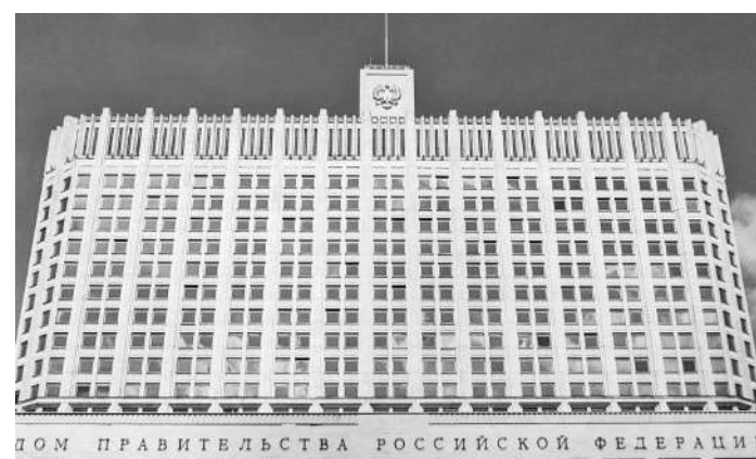
ДОМ ПРАВИТЕЛЬСТВА РОССИЙСКОЙ ФЕДЕРАЦИИ

Федеральное финансирование обеспечит дальнейшую реализацию мероприятий по обновлению жилищно-коммунальной инфраструктуры и модернизации инженерных сетей, начатую в 2022 году.