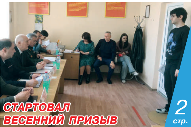
СТАРТОВАЛ ВЕСЕННИЙ ПРИЗЫВ