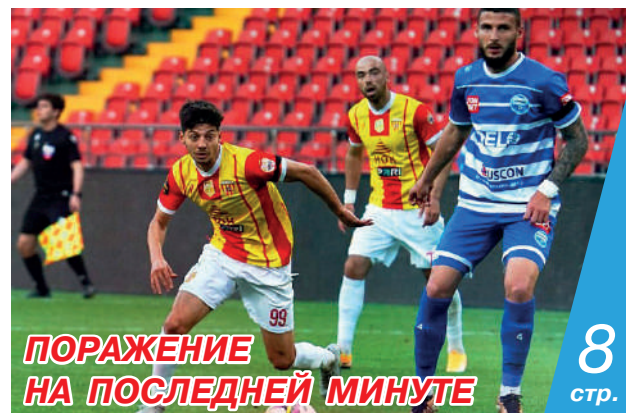
ПОРАЖЕНИЕ НА ПОСЛЕДНЕЙ МИНУТЕ