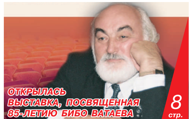
ОТКРЫЛАСЬ ВЫСТАВКА, ПОСВЯЩЕННАЯ 85-ЛЕТИЮ БИБИ БАТАЕВА