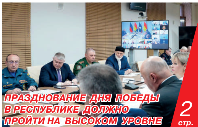
ПРАЗДНОВАНИЕ ДНЯ ПОБЕДЫ В РЕСПУБЛИКЕ ДОЛЖНО ПРОЙТИ НА ВЫСОКОМ УРОВНЕ