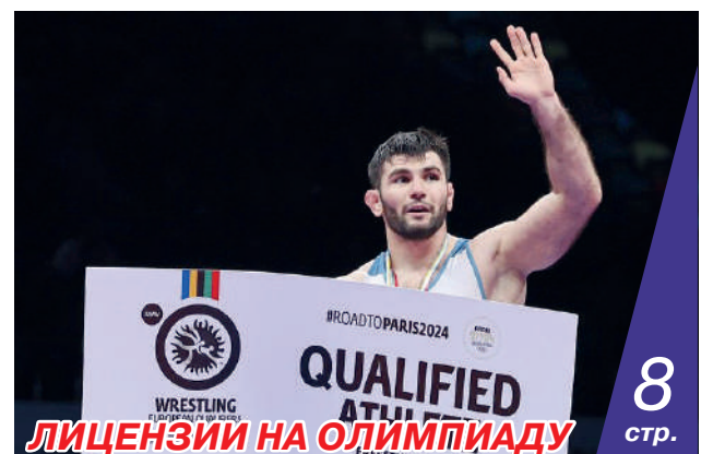
ЛИЦЕНЗИИ НА ОЛИМПИАДУ