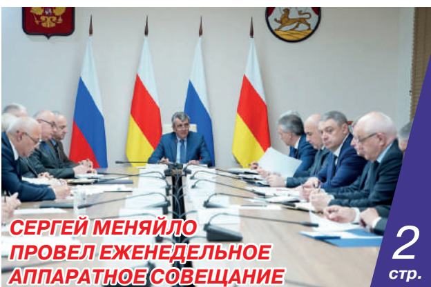
СЕРГЕЙ МЕНЯЙЛО ПРОВЕЛ ЕЖЕНЕДЕЛЬНОЕ АППАРАТНОЕ СОВЕЩАНИЕ

проориентационные и научно-популярные мероприятия. Школьников ждет турнир и серия мастер-классов по химии, биологии, астрономии и информационным технологиям. Торжественная церемония открытия состоялась в СОГУ.