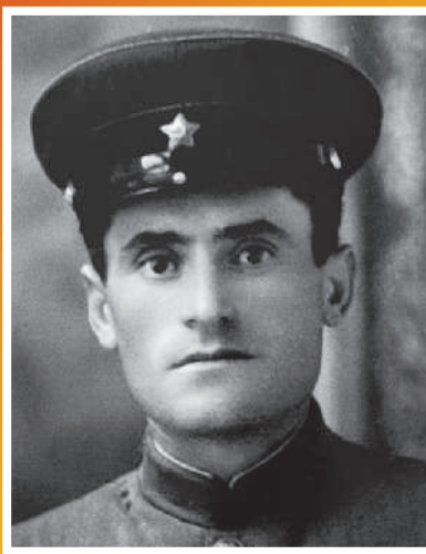
КЦОВЕВ АЛИХАН АУЗБИЕВИЧ 1918–1990