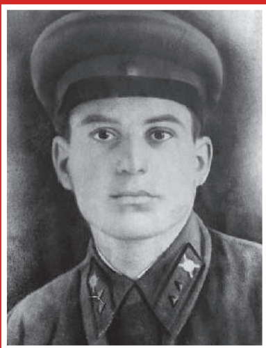
ГОБОЗОВ ВЛАДИМИР СЕРГЕЕВИЧ 1910–1945