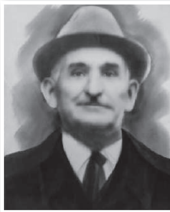
КЕСАЕВ ЕСТДА ХАСАКОВИЧ 1905–1989