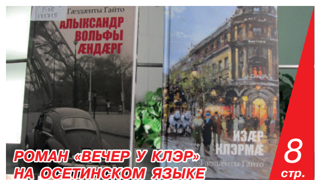
РОМАН «ВЕЧЕР У КЛЭР» НА ОСЕТИНСКОМ ЯЗЫКЕ