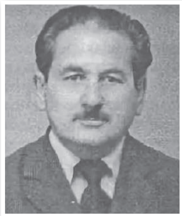
БУКУЛОВ АЛЕКСЕЙ ДМИТРИЕВИЧ 1920–2010