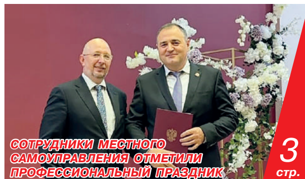
СОТРУДНИКИ МЕСТНОГО САМОУПРАВЛЕНИЯ ОТМЕТИЛИ ПРОФЕССИОНАЛЬНЫЙ ПРАЗДНИК