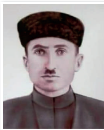
ТОМАЕВ ГОГА ДОЛАЕВИЧ 1889–1943