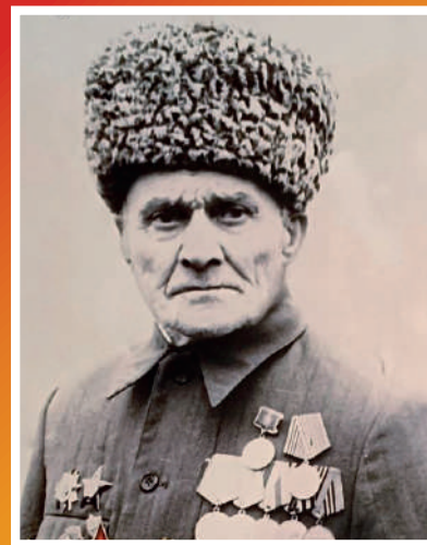
ЕЗЕЕВ ДЗИБЛО БАБУЕВИЧ 1908–1992