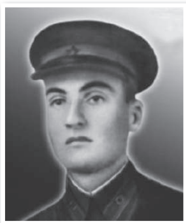
ИКАЕВ БАГРАТ ПИРУЗОВИЧ 1916–1943