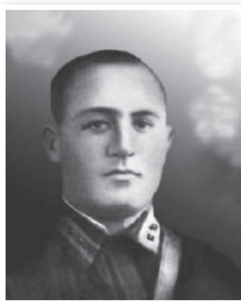
ИКАЕВ ГЕОРГИЙ АЛЕКСАНДРОВИЧ 1919–2003