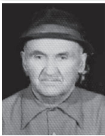
КУДУХОВ КОНСТАНТИН ТАЙМУРАЗОВИЧ 1906–1987