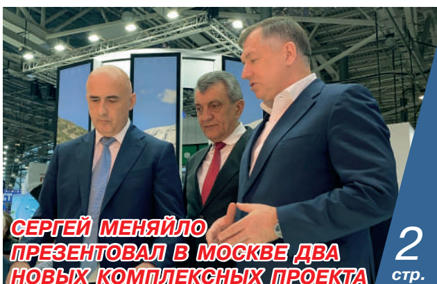
СЕРГЕЙ МЕНЯЙЛО ПРЕЗЕНТОВАЛ В МОСКВЕ ДВА НОВЫХ КОМПЛЕКСНЫХ ПРОЕКТА