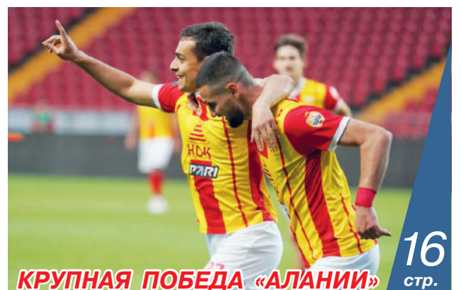
КРУПНАЯ ПОБЕДА «АЛАНИИ»