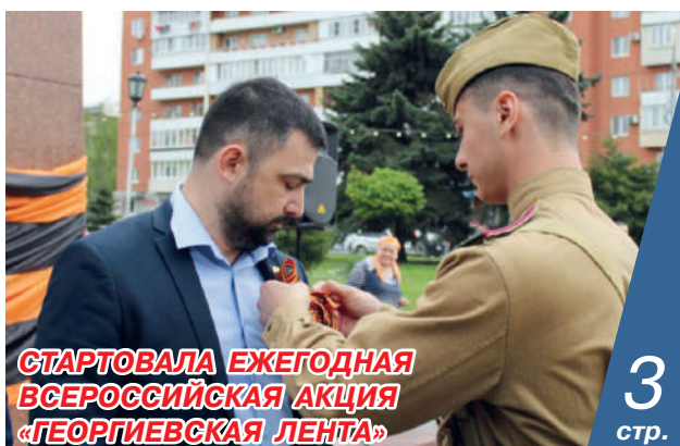
СТАРТОВАЛА ЕЖЕГОДНАЯ ВСЕРОССИЙСКАЯ АКЦИЯ «ГЕОРГИЕВСКАЯ ЛЕНТА»