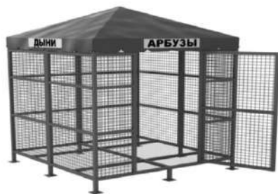
Приложение № 1 к Положению о порядке размещения нестационарных торговых объектов и объектов по оказанию услуг на территории муниципального образования город Владикавказ

В аукционную комиссию по предоставлению права на размещение НТО на территории города Владикавказа Заявка (заявление) на участие в аукционе по предоставлению права на размещение нестационарного торгового объекта на территории муниципального образования город Владикавказ