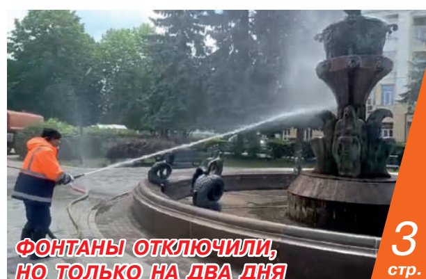
ФОНТАНЫ ОТКЛЮЧИЛИ, НО ТОЛЬКО НА ДВА ДНЯ