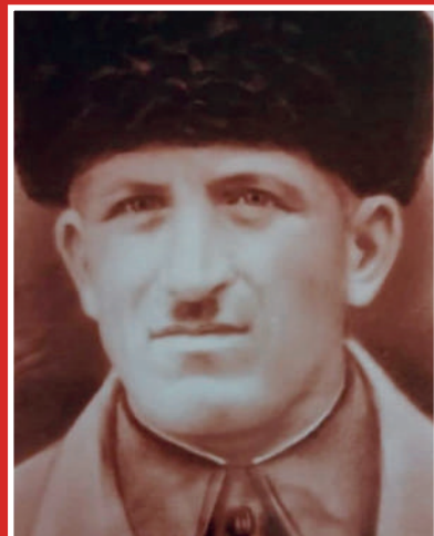
ЧЕРЧЕСОВ Урусхан Сахмурзаевич 1896–1943