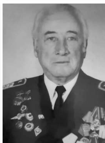
АГНАЕВ Александр Николаевич 1915–2009