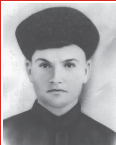
ГУРИЕВ Астемир Хангериевич 1921–1942