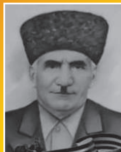
ХИНЧАГОВ Дато Георгиевич 1913–1978