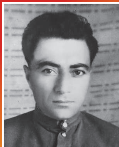
КАРАШАЕВ Гайши Эльзарикович 1914–1988