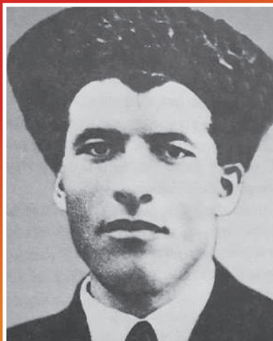
МАМСУРОВ Махамат Куцукович 1901–1943