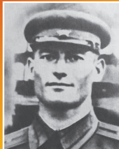
МАМСУРОВ Роман Харламович 1923–1943