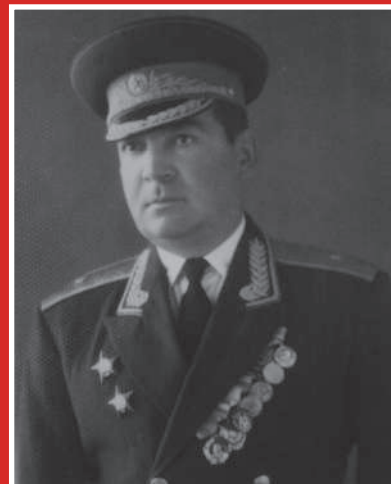
ХАРЕБОВ Зелимхан Арсенович 1910–1995