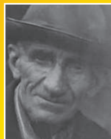
ХИНЧАГОВ Арсен Георгиевич 1927–1993