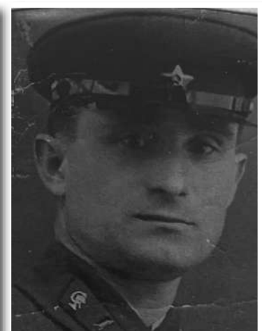
АГНАЕВ Владимир Ильич 1909–1965