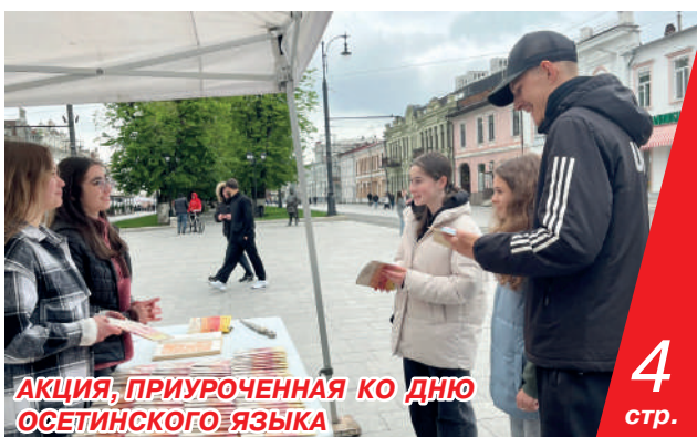
АКЦИЯ, ПРИУРОЧЕННАЯ КО ДНЮ ОСЕТИНСКОГО ЯЗЫКА