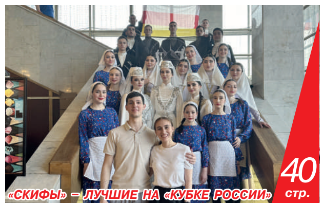
«СКИФЫ» – ЛУЧШИЕ НА «КУБКЕ РОССИИ»