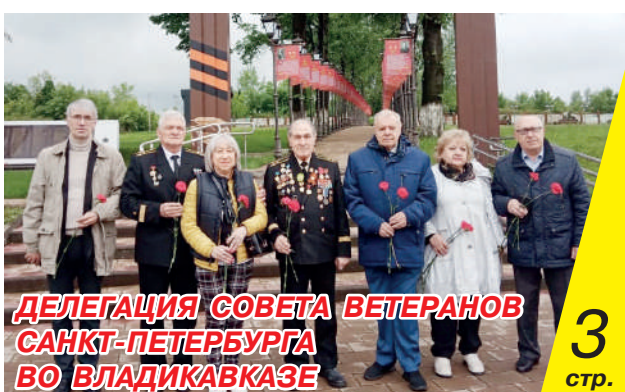
ДЕЛЕГАЦИЯ СОВЕТА ВЕТЕРАНОВ САНКТ-ПЕТЕРБУРГА ВО ВЛАДИКАВКАЗЕ