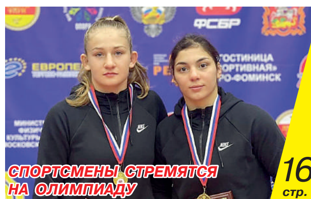
СПОРТСМЕНЫ СТРЕМЯТСЯ НА ОЛИМПИАДУ