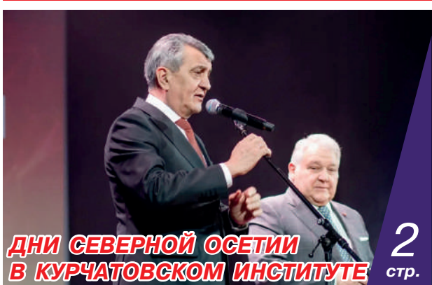
ДНИ СЕВЕРНОЙ ОСЕТИИ В КУРЧАТОВСКОМ ИНСТИТУТЕ 2 стр.