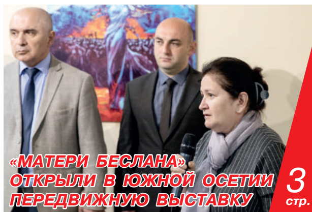
«МАТЕРИ БЕСЛАНА» ОТКРЫЛИ В ЮЖНОЙ ОСЕТИИ ПЕРЕДВИЖНУЮ ВЫСТАВКУ