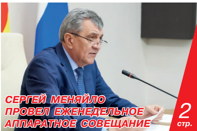
СЕРГЕЙ МЕНЯЙЛО ПРОВЕЛ ЕЖЕНЕДЕЛЬНОЕ АППАРАТНОЕ СОВЕЩАНИЕ