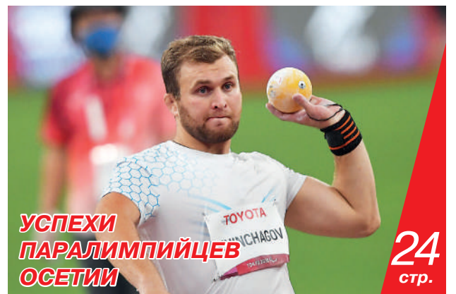
УСПЕХИ ПАРАЛИМПИЙЦЕВ ОСЕТИИ