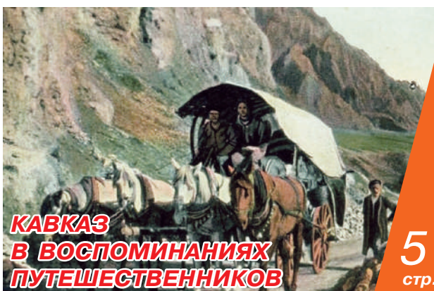
КАВКАЗ В ВОСПОМИНАНИЯХ ПУТЕШЕСТВЕННИКОВ