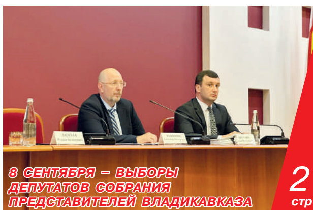
8 СЕНТЯБРЯ – ВЫБОРЫ ДЕПУТАТОВ СОБРАНИЯ ПРЕДСТАВИТЕЛЕЙ ВЛАДИКАВКАЗА