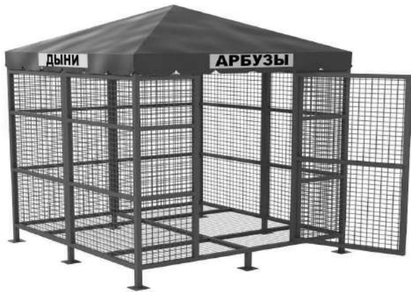
Приложение № 1 к Положению о порядке размещения нестационарных торговых объектов и объектов по оказанию услуг на территории муниципального образования город Владикавказ

В аукционную комиссию по предоставлению права на размещение НТО на территории города Владикавказ