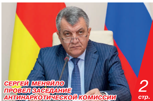
СЕРГЕЙ МЕНЯЙЛО ПРОВЕЛ ЗАСЕДАНИЕ АНТИНАРКОТИЧЕСКОЙ КОМИССИИ