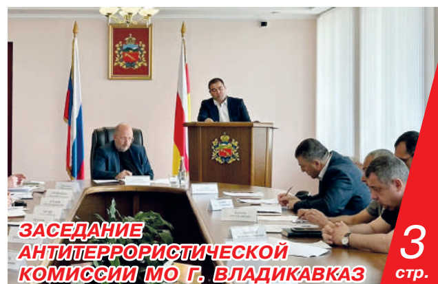
ЗАСЕДАНИЕ АНТИТЕРРОРИСТИЧЕСКОЙ КОМИССИИ МО Г. ВЛАДИКАВКАЗ