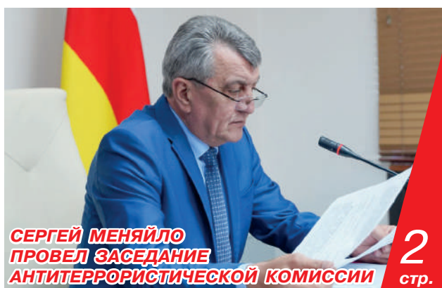
СЕРГЕЙ МЕНАЙЛО ПРОВЕЛ ЗАСЕДАНИЕ АНТИТЕРРОРИСТИЧЕСКОЙ КОМИССИИ