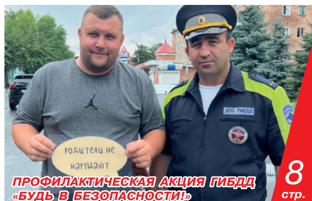
ПРОФИЛАКТИЧЕСКАЯ АКЦИЯ ГИБДД «БУДЬ В БЕЗОПАСНОСТИ!»