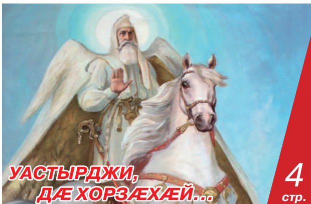
УАСТЫРДЖИ, ДАЕ ХОРЗАЕХАЙ... 4 стр.