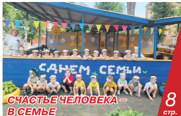
СЧАСТЬЕ ЧЕЛОВЕКА – В СЕМЬЕ 8 стр.