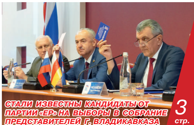
СТАЛИ ИЗВЕСТНЫ КАНДИДАТЫ ОТ ПАРТИИ «ЕР» НА ВЫБОРЫ В СОБРАНИЕ ПРЕДСТАВИТЕЛЕЙ Г. ВЛАДИКАВКАЗА 3 стр.

крупных региональных пабликов. Обсуждение насущных для региона вопросов продолжалось около трех часов. Говорили о транспорте и строительстве, земельных вопросах и обновлении социальных объектов, предстоящих выборах и современных героях.