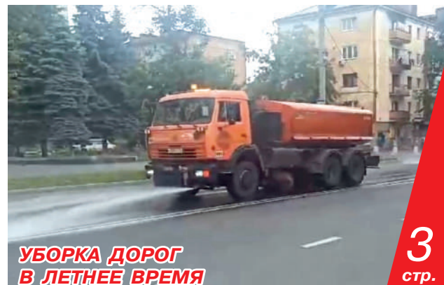
УБОРКА ДОРОГ В ЛЕТНЕЕ ВРЕМЯ