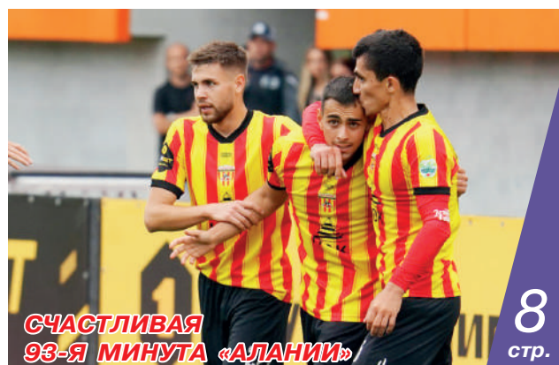
СЧАСТЛИВАЯ 93-Я МИНУТА «АЛАНИИ»