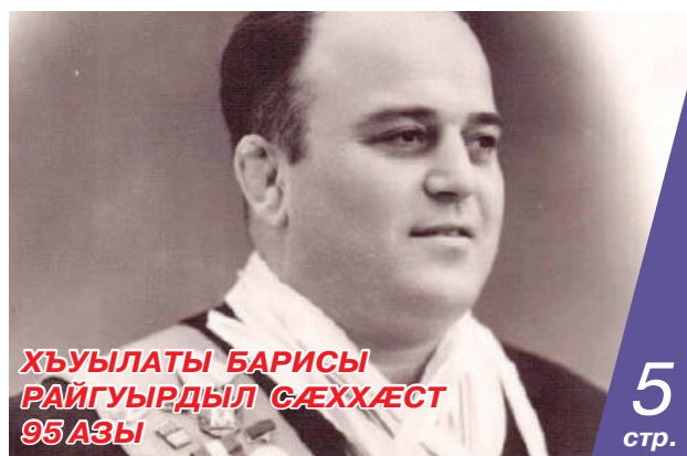
ХЪУЫЛАТЫ БАРИСЫ РАЙГУЫРДЫЛ СÆХХÆСТ 95 АЗЫ