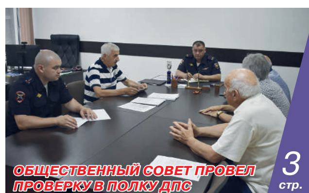
ОБЩЕСТВЕННЫЙ СОВЕТ ПРОВЕЛ ПРОВЕРКУ В ПОЛКУ ДПС 3 стр.