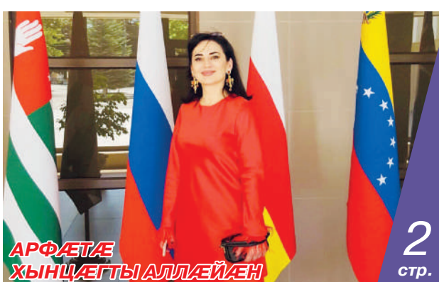
АРФЕТА ХЫНЦАЕГТЫ АЛЛАЙЕН 2 стр.