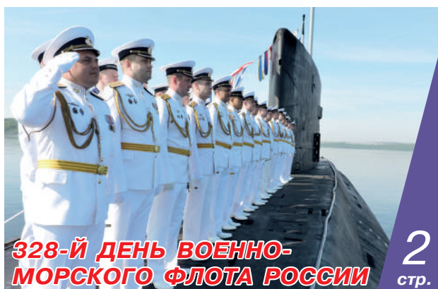
328-Й ДЕНЬ ВОЕННО-МОРСКОГО ФЛОТА РОССИИ