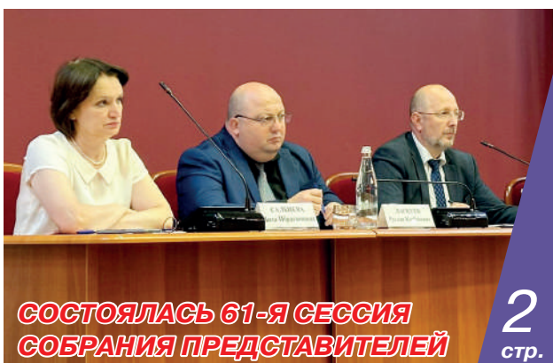
СОСТОЯЛАСЬ 61-Я СЕССИЯ СОБРАНИЯ ПРЕДСТАВИТЕЛЕЙ

ВО ВЛАДИКАВКАЗЕ ОТКРЫЛАСЬ КНИЖНАЯ ЯРМАРКА-ФЕСТИВАЛЬ «100-ЛЕТИЕ: ОТ А ДО Я», ПРИУРОЧЕННАЯ К ПРАЗДНОВАНИЮ ВЕКОВОГО ЮБИЛЕЯ СО ДНЯ ОБРАЗОВАНИЯ СЕВЕРНОЙ ОСЕТИИ