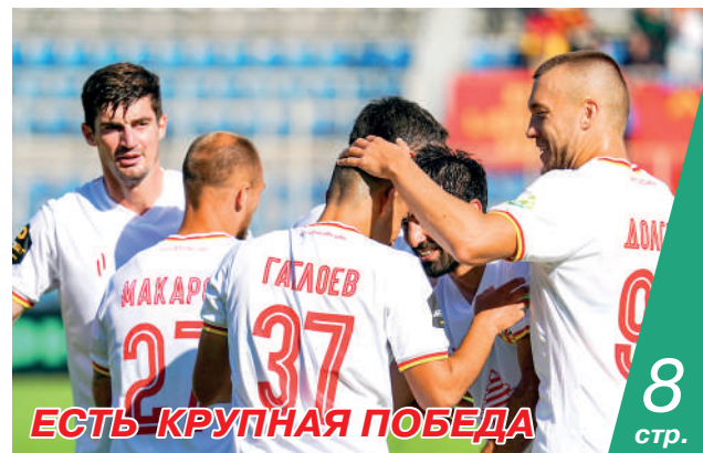
ЕСТЬ КРУПНАЯ ПОБЕДА