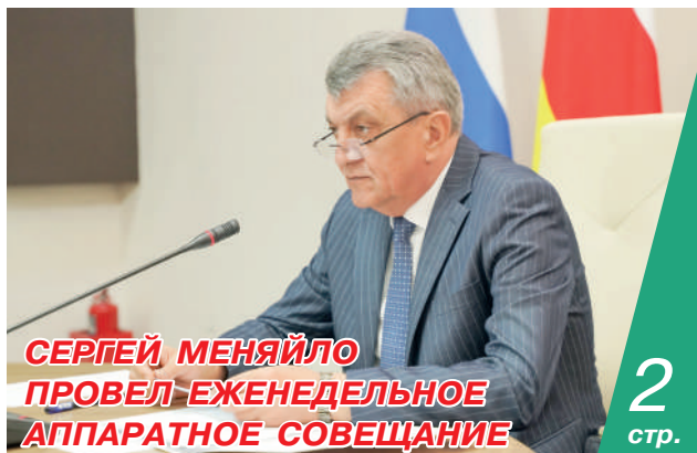
СЕРГЕЙ МЕНЯЙЛО ПРОВЕЛ ЕЖЕНЕДЕЛЬНОЕ АППАРАТНОЕ СОВЕЩАНИЕ