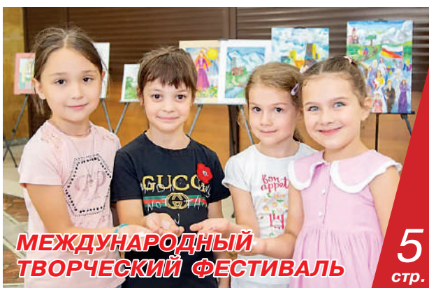
МЕЖДУНАРОДНЫЙ ТВОРЧЕСКИЙ ФЕСТИВАЛЬ