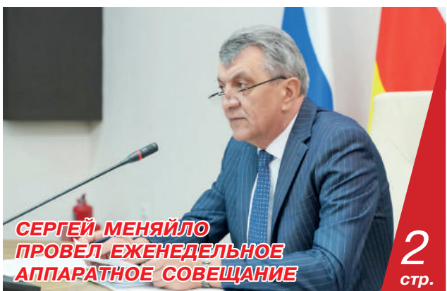
СЕРГЕЙ МЕНЯЙЛО ПРОВЕЛ ЕЖЕНЕДЕЛЬНОЕ АППАРАТНОЕ СОВЕЩАНИЕ