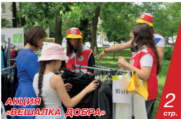
АКЦИЯ «ВЕШАЛКА ДОБРА»