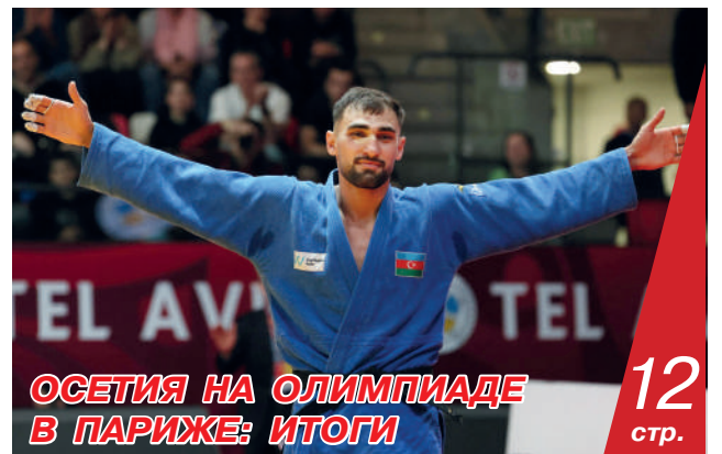
ОСЕТИЯ НА ОЛИМПИАДЕ В ПАРИЖЕ: ИТОГИ