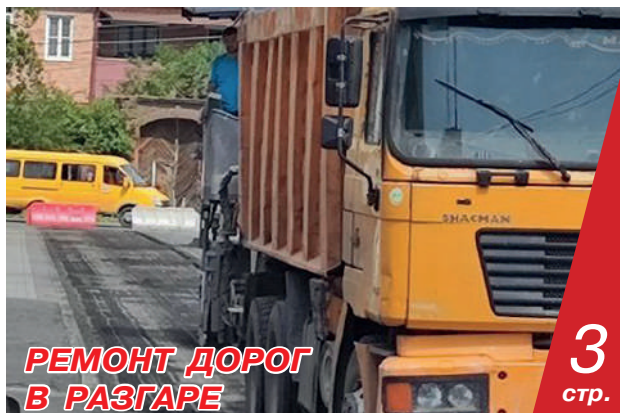
РЕМОНТ ДОРОГ В РАЗГАРЕ