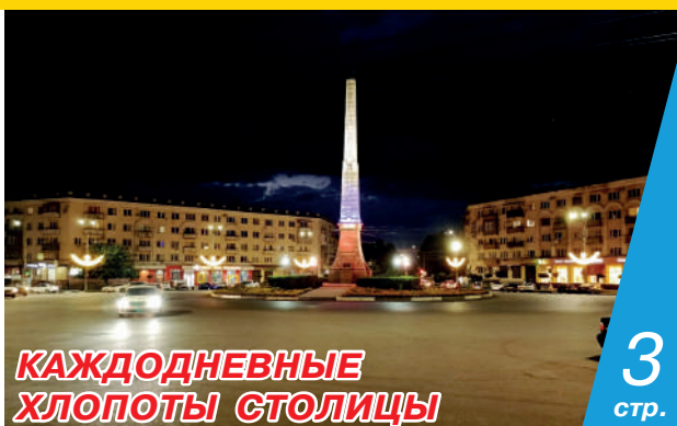
КАЖДООДНЕВНЫЕ ХЛОПОТЫ СТОЛИЦЫ