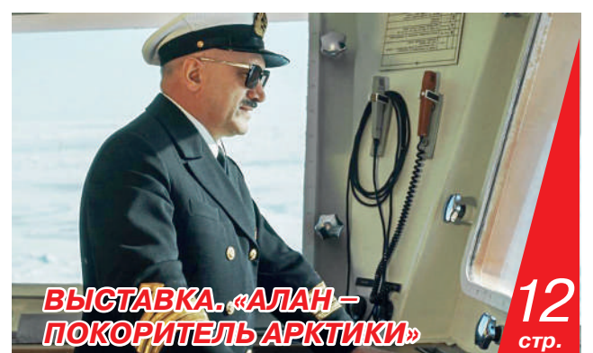
ВЫСТАВКА. «АЛАН – ПОКОРИТЕЛЬ АРКТИКИ»