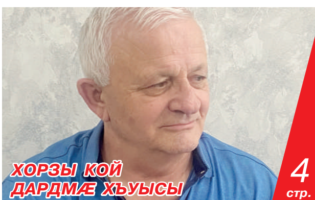
ХОРЗЫ КОЙ ДАРДМАЕ ХЪУЫСЫ