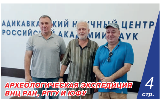
АРХЕОЛОГИЧЕСКАЯ ЭКСПЕДИЦИЯ ВНЦ РАН, РГУ И ЮФУ 4 стр.