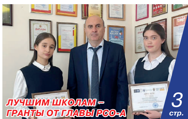
ЛУЧШИМ ШКОЛАМ – ГРАНТЫ ОТ ГЛАВЫ РСО-А 3 стр.