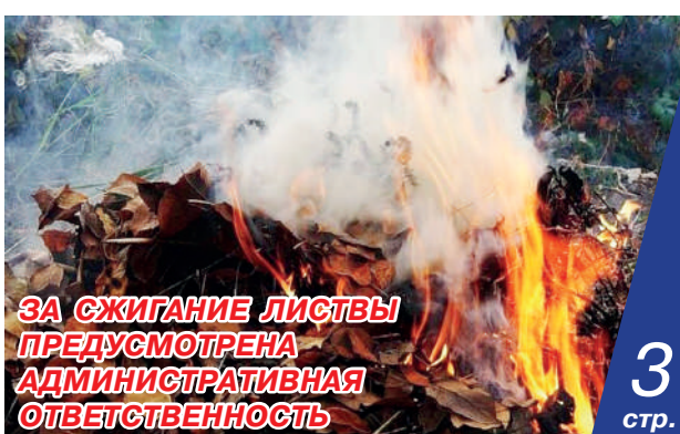
ЗА СЖИГАНИЕ ЛИСТЫ ПРЕДУСМОТРЕНА АДМИНИСТРАТИВНАЯ ОТВЕТСТВЕННОСТЬ